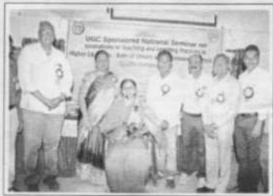
ఆర్.జె.డి. చా. దర్శన్ ను సన్మానిస్తున్న అధ్యాపకులు